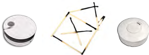
#47872457 © Dreadlock / Fotolia

Wir bieten Ihnen modernste Geräte zur Verbrauchserfassung von Wärme und Wasser.